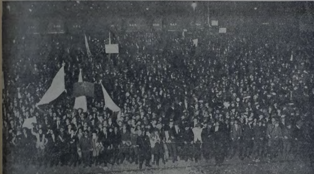
PARTE DEL PUBLICO QUE DESDE LA TARDE ESPERO A LA DELEGACION.