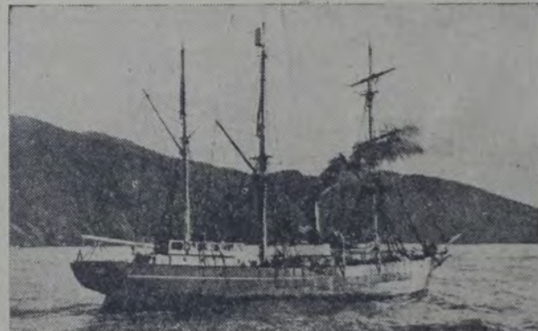
EL "NEMROD", BUQUE EMPLEADO POR LA EXPEDICION SHACKLETON al polo sur.