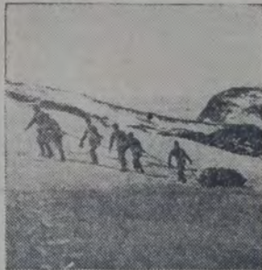
MIEMBROS DE LA EXPEDICION Shackleton en el monte Erebus, el 5 de marzo de 1908.

Franquesada ya la Groenlandia, al llegar a la cuenca atlántica, cambió el tiempo. De entonces en adelante los aviadores hubieron de luchar su batalla contra la bruma y la nieve, y de defenderse contra la tormenta. Después de horas de lucha, lograron aterrizar en Spitzberg. Habían realizado, en un vuelo de veintidós horas, el objetivo de su empresa: volar sobre el polo ártico trayendo una distancia igual a la que se para a Terranova de la costa oeste de Irlanda. Esa hazaña se había realizado con un monoplano de 800 kilos de peso total.