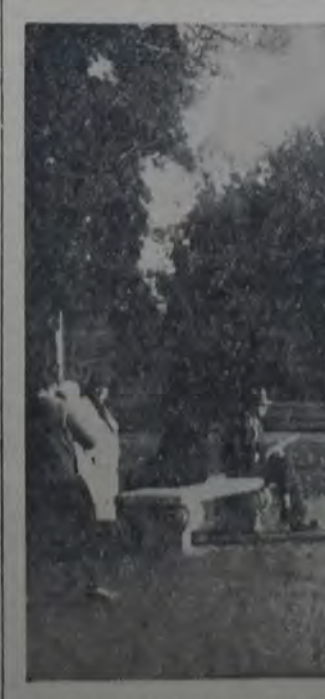
HOY SE INAUGURA OFICIALMENTE EL PARQUE BERNARDINO RIVADAVIA, CREADO, COMO SE SABE, en el viejo latifundio urbano de la Quinta Lezica. El parque Rivadavia ha venido a traer la alegría y la vida a todo un extendido barrio, especialmente el situado sobre la calle Rosario, que antes vejetaba en el aislamiento, separado por un muro anticristiano de más de cuatrocientos metros