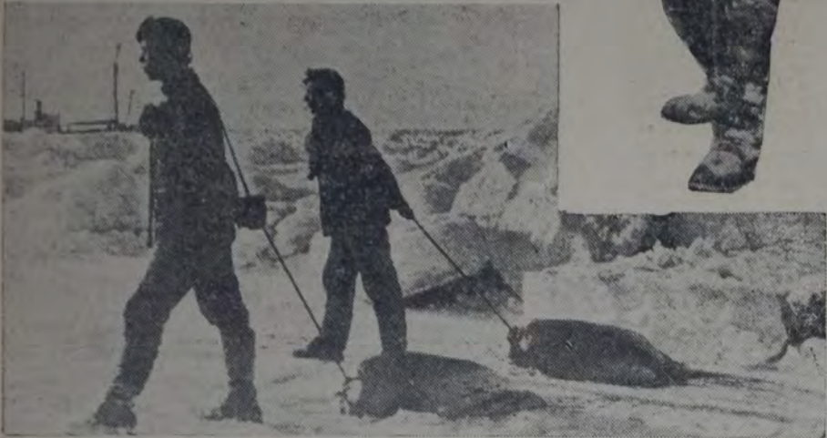
LA CAZA DE LAS FOCAS EN EL OCEANO ARTICO — LOS CAZADORES ARRASTRANDO SOBRE EL HIELO las pieles de los animales capturados — Arriba, uno de los cazadores con una pequeña foca viviente