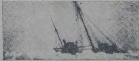
LA PRESION DEL HIELO VENCIO LA RESISTENCIA DEL buque que comienza a hundirse