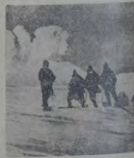
UNA DE LAS FUMAROLAS DEL antiguo cráter: los vapores sulfurosos, congelándose al llegar a la superficie, forman montículos de hielo amarillento