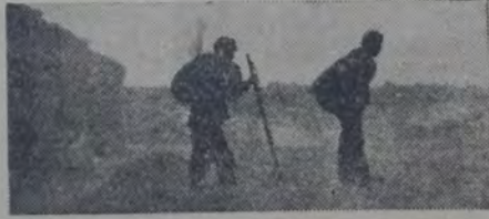
COMPLETAMENTE DESAMPARADOS, LOS MIEMBROS de la tripulación intentan el regreso a pie