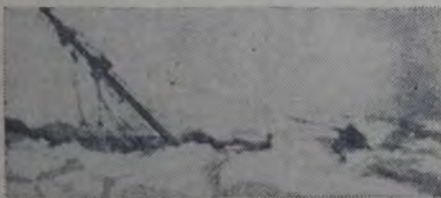
LA EMBARCACION DESAPARECE SIN REMEDIO, sepultándose bajo el hielo