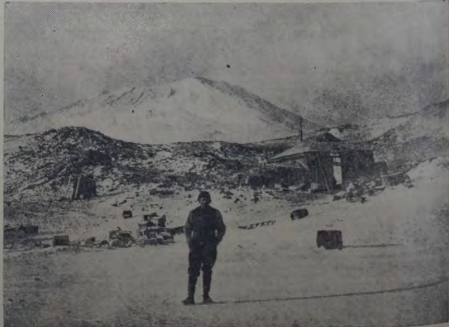
LOS CUARTELES DE INVIERNO, EN EL CABO ROYDS. — AL FRENTE EL JEFE DE LA EXPEDICION, SHACKLETON. — Al fondo, el volcán Erebus.

se erguían por ambos lados, la majestuosidad del enorme témpano cuyas pendientes ascendíamos pensosamente, no nos interesaban ya. El hombre se vuel-