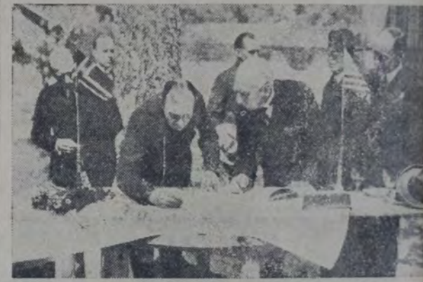
EN SVARTSKOG, CERCA DE OSLO, EN LA PROPIEDAD DE AMUNDSEN: Wilkins (a la izquierda), mostrando al viejo explorador polar el trayecto que recorrió por encima de la cuenca ártica. A la derecha, el piloto Eielson