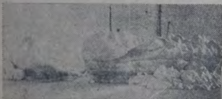
LOS TEMPANOS ENVUELVEN LA EMBARCACION, levantándola de su base sobre el mar