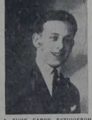
A CUYO CARGO ESTUVIERON los números de recitación del festival de anoche

por el Comité Juan A. Luoni, justificó ampliamente esa expectativa.