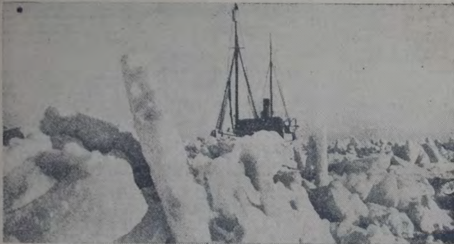
PELIGROSA SITUACION DE UNA EMBARCACION DE CAZADORES DE FOCAS, CONTRA LA QUE EL HIELO ejerce presión por todos lados